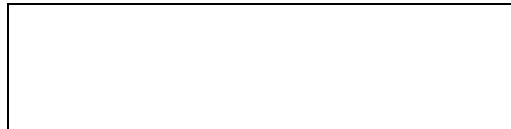
Схема границы балансовой принадлежности

д) границей эксплуатационной ответственности объектов централизованной системы водоотведения организации водопроводно-канализационного хозяйства и заказчика является: